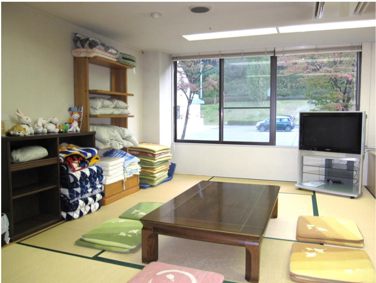
大きな窓からは、四季折々の風景が楽しめます。