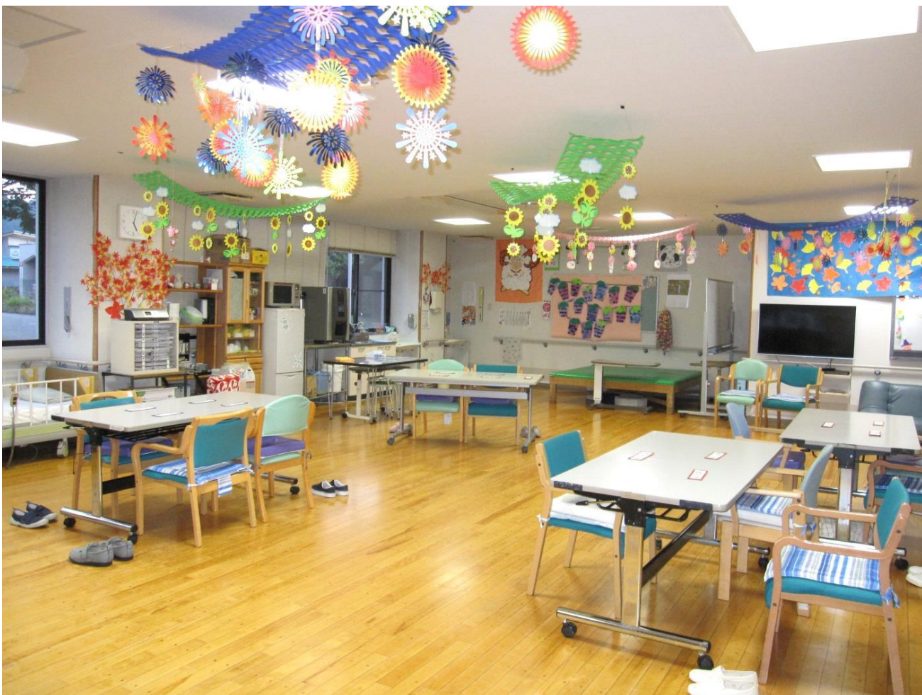
ご利用者と四季に合わせた壁画を作成しています。